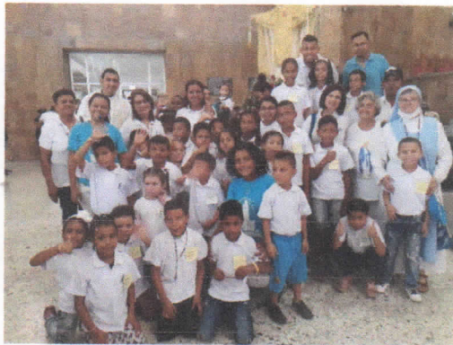
ACTIVIDAD EN CATEDRAL