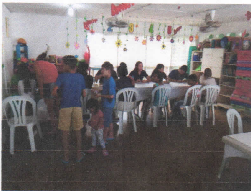
BRIGADA DE SALUD