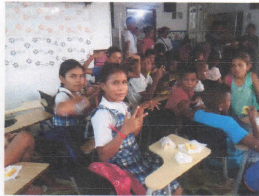
ACTIVIDAD DIARIA DE ESTUDIO