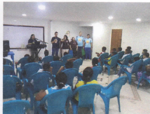
RETIRO EN LAZOS DE AMOR MARIANO