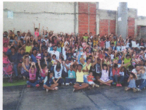
ACTIVIDADES DE RECREACION